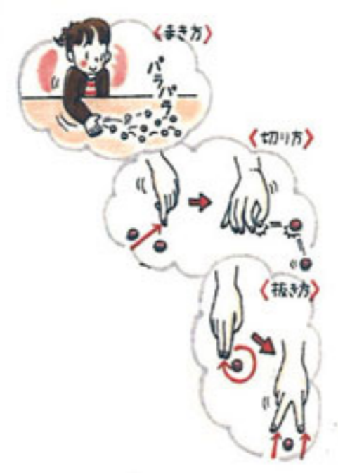
おはじきに触れないように！！

会社の前の駐車場に、今年も紫陽花が咲く季節になりました。梅雨、真っ盛り。憂鬱な気分になりがちな季節ですが、雨に濡れた紫陽花は風情がありますね。梅雨の憂鬱な気分も癒されて、楽しい気分になれそうです。紫陽花は、挿し木で簡単に増やせるそうです。チャレンジしてみたいかがでしょうか？ 子供たちには退屈な季節ですが、何か家の中で楽しく遊べることはないかな……。と思う今日この頃です。